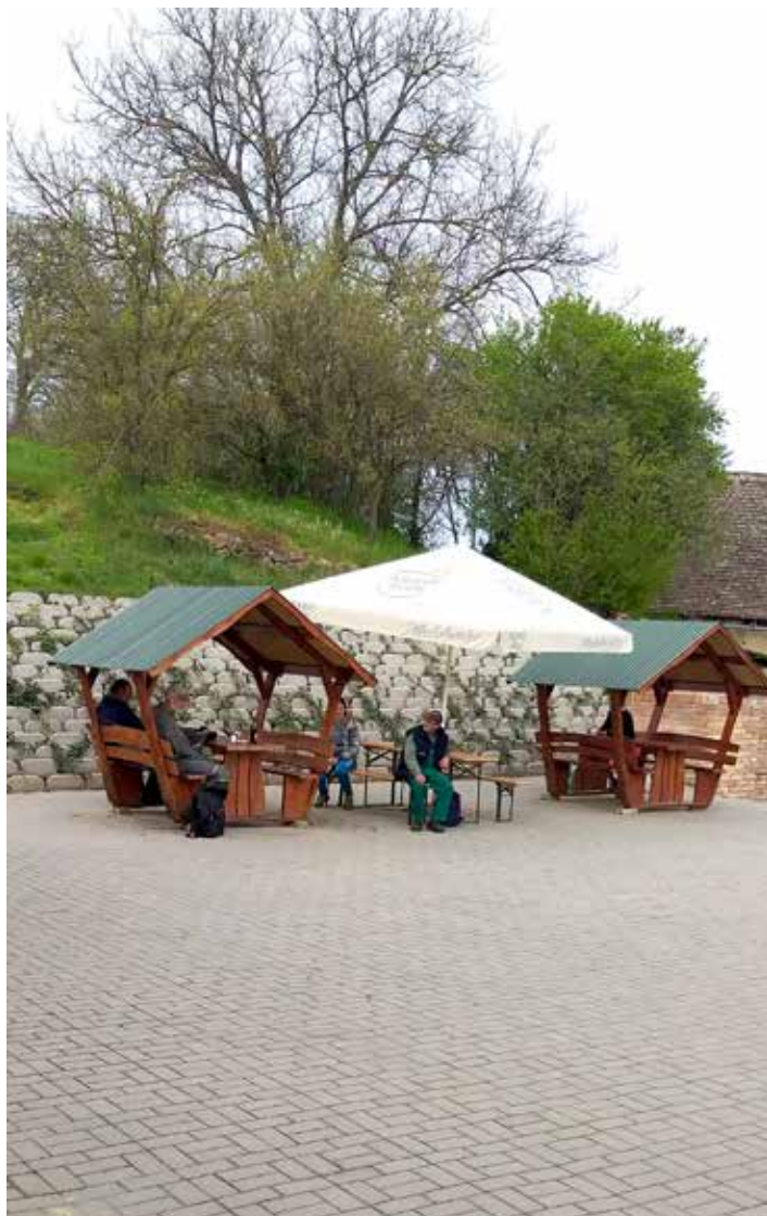
Mocsényben is létezik, sőt, már működik is vendéglátó egységhez tartozó terasz, kellemes környezetben és kulturált kivitelezésben

TETT-ES TELEPÜLÉSEK A címben megfogalmazott kérdést tettük fel a TETT-es települések vezetőinek, de előtte egy rövid helyzetjelentés is kértünk tőlük. Tekintettel arra, hogy enyhült a járvány szorítása, az óvodák, az iskolák alsó tagozatai, valamint már a vendéglátóhelyek teraszaira is ki lehet ülni.