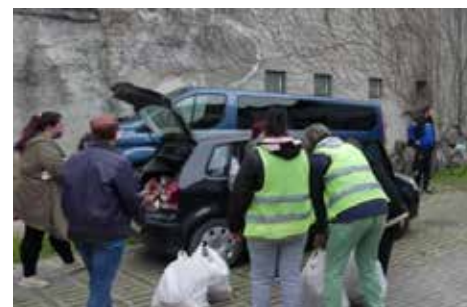
Eszállításra váró ajándécsomagok

A játékonysági akcióban az önkormányzat és a Gondozási Központ alkalmazottain kívül kiemelt feladatot vállaltak a Bátaszéki Marketing Nonprofit Kft., a Bátaszéki Önkormányzati Tűzoltóság, a Bátaszéki Polgárőr Egyesület, a BÁT-KOM 2004 Kft., a Bátaszéki Sport Egyesület és a Bátaszéki Mikrotérségi Óvoda, Bölcsőde és Konyha munkatársai is. Velük együtt köszönet illeti mindazokat, akik bármilyen módon hozzájárultak az adománygyűjtés sikerességéhez.