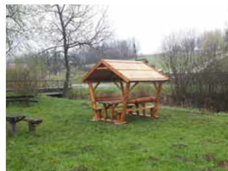
Az egyik fedett pad a játszótérre került

– A két fedett paddal köztereinket igyekeztük szépíteni – folytatta a kuratóriumi elnök. – A játszótér, a focipálya a helybeliek, főleg a fiatalok gyakori találkozóhelye. Eddig