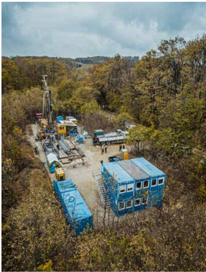
Három év kihagyás után újraindult a Nyugat-Mecsekben a földtani kutatás

PAKS Talán sosem volt még ennyire aktuális a természetről mint egy fölöttes hatalomról beszélni. Arról, hogy mi emberek mit tehetünk meg és meddig... mi az a pont, amely után – ha úgy tetszik – „megtorlás” következik. Ha visszatekintünk az elmúlt évekre, egyre inkább kirajzolódik, hogy a bolygó, amelyet életterünként kaptunk fel-felhorkan, odavág, ha kell, hogy megálljt parancsoljon. Igen, ilyenkor rémisztő arcát mutatja.