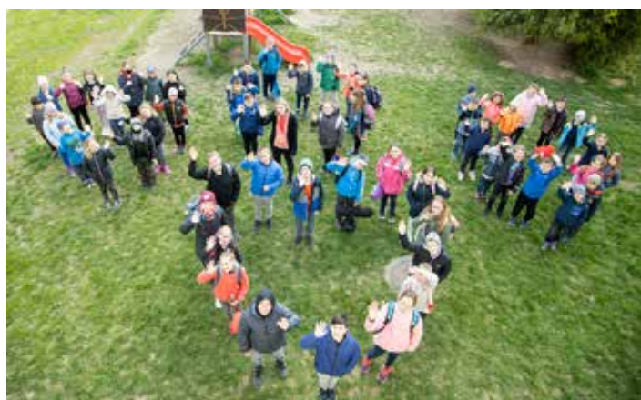
Örömteli pillanat alsó tagozatosokkal a Véméndi Általános Iskola udvarán