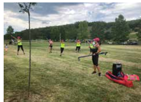
Edzenek a hölgyek az ófalui sportpályánál

Augusztus 21-én az érdeklődőket felhőtlen szórakozás várta, zenés műsorokkal, kézműveskedéssel, légvárral, zsbivásárral és babgulyással.