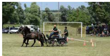
Lovak, fogatok, hajtók és közönség

A lovas rendezvény külön is megérdemel néhány mondatot. Cikón a helybeliek sok háttast tartanak, ezek a derék négy lábúak gyakorta szerephez jutnak a felvonulásokon. A Lovas Napon pedig a már említett akadályhajtásban, valamint gyermek és felnőtt kategóriában rendezett, háttas akadályversenyen galoppoztak vagy ügettek. A cikói elköteleződést jól mutatja, hogy a település lakói közül sokan viselték a helyi lovas egyesület polóját, ezt tette a polgármester is. A Családi Nap után egy héttel ünnepelte fen-