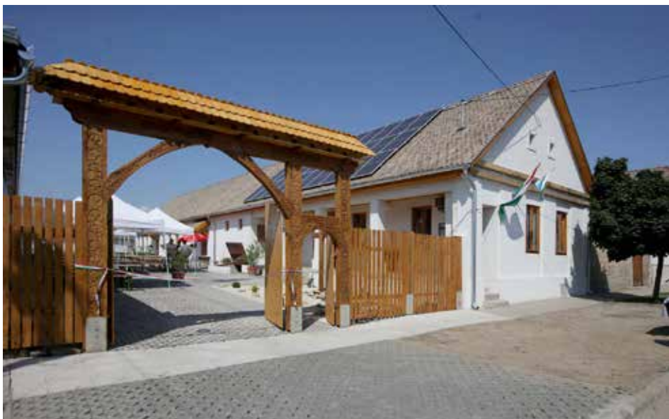
A Székelyek Háza, melyben tájszobák várják a látogatókat