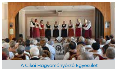
A Cikói Hagyományőrző Egyesület