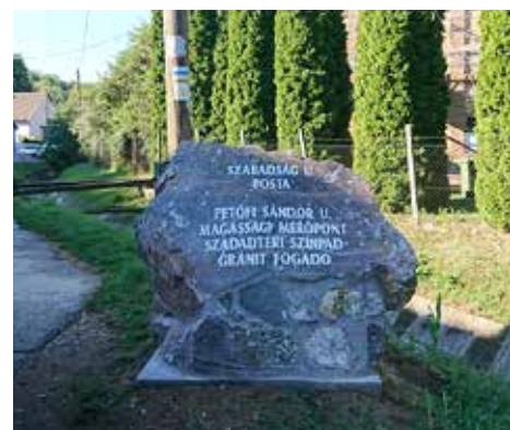
Így néz ki egy mórággyi, útba igazító gránit tömb

– Úgy tűnik, nagy tetszést arattak a településen azok az útba igazító, közepes méretű gránit tömbök, melyeket az elágazásoknál helyeztünk ki – ismertette ezt a különleges