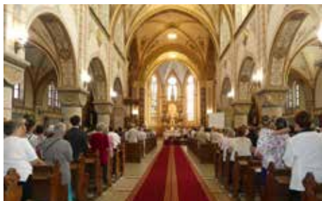
Bátaszék, szentmise a Nagyboldogasszony Plébániatemplomban