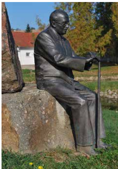
Habsburg Ottó szobra a feked parkban

FEKED Sokan nem is gondolnák, hogy egy olyan kis település, mint a nagyjából kétszáz fős Feked, életnagyságú bronz szoborral rendelkezik. A Habsburg Ottót ábrázoló alkotás a központ parkjában, kicsiny tavacska mellett található. Az Unser Bildschirm című, német nyelvű televíziós hírműsor augusztus 10-i adása – Gerner Éva szerkesztésében – annak járt utána, hogy miként is került ez a szobor a faluba.