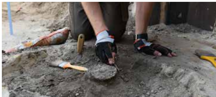
Avar kori sírok feltárása

PAKS Különleges régészeti leletekre bukkantak a Paksi Atomerőmű egyik munkaterületén 2021. július 16-án. A négy avar kori sír feltárását követően a hónap végén újabb hat sírhelyet találtak, amelyek tovább gazdagítják majd Paks és környékének történelmi múltját, egyben az atomerőmű területéről származó emlékek sorát is.