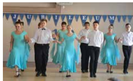
A cikói kisdiákok színvonalas, látványos műsort adtak a gálán

Úgy gondolom, hogy Cikó település az intézményeivel együtt az igazán szerethető falvak közé tartozik. Kívánom, hogy mindannyian legyünk büszkéek településünkre, a település és intézményei szépüléséért, fejlődéséért, kultúrájért, hagyományai megőrzéséért tenni akaró személyekre és arra, hogy a községet önzetlen és összetartó emberek lakják.