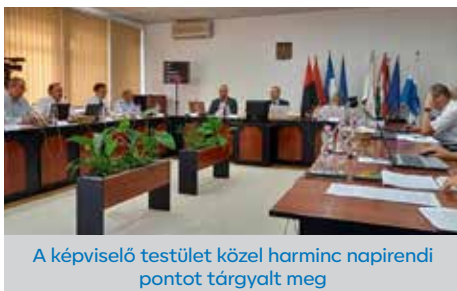
A képviselő testület közel harminc napirendi pontot tárgyalt meg