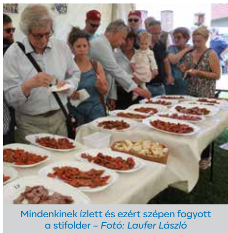
Mindenkinek ízlett és ezért szépen fogyott a stifolder

FEKED Az emberek éhesek a jóra. Különösen akkor, ha finom falatok várják őket, mint történt az június 11-én, szombaton az immár XI. Stifolder Fesztivál alkalmával.