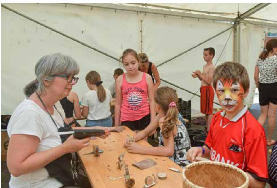
A szabadtéri sátorban kézműves foglalkozások adtak teret a kreativitásnak

nosabbnak. A hulladéktároló léte egyébként nemcsak hozadékában – az imént említett támogatás, avagy munkaalkalmak okán –, hanem önmagában is fontos az ország, a régió, de Bátaapáti számára is.