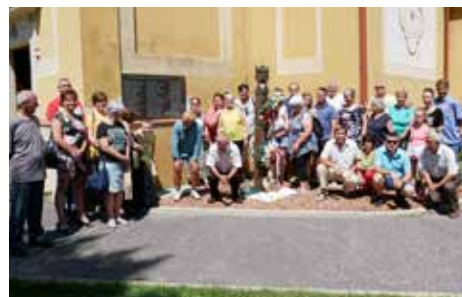
A mórágycsapat a féli templomnál. Az épület falán emléktábla közli a kitelepített magyarok neveit