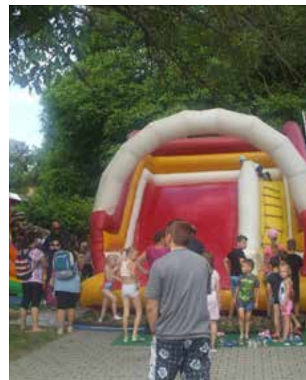
Az egyik legnépszerűbb játéknak a légvár számított