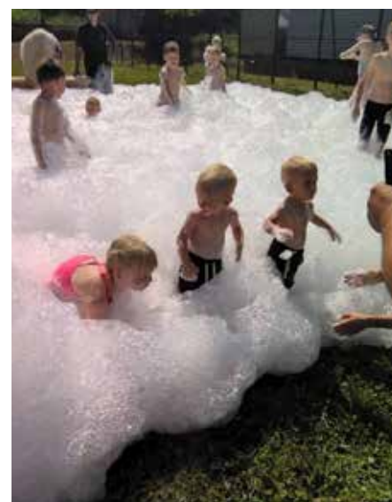
A habparti kellemes volt a nagy melegben