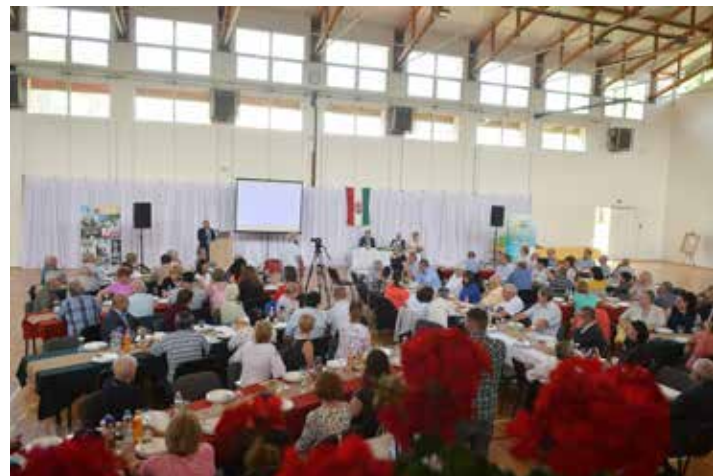
Bátaapáti, Bátaszék, Cíkó, Feked, Ófalu, Mórág, Mócsény és Véménd települések küldöttjei – köztük polgármesterei, önkormányzati képviselői – a konferenciának helyszínt adó sportszarnokban

– Még 2002-ben egy biztonságnövelő programot indítottunk a Radioaktív Hulladék Feldolgozó és Tárolóban (RHFT), amelynek célja a biztonság fenntartásához és fokozásához szükséges műszaki-technológiai feltételek kialakítása, a 70-es 80-as években elhelyezett hulladékok kitermelése, átválogatása, újra csomagolása – mondta. – A visszatermelt hulladékok számára az RHFT átmeneti tárolórészében kell a kapacitást biztosítanunk. Mivel ez a tárolórész jelenleg megtelt, ezért az RHFT telephelyéről a hulladékcsomagok egy részét az NRHT hulladékátvételi követelményeinek való megfeleltetése után átszállítjuk a bátaapáti tárolóba. Az ezen tevékeny-