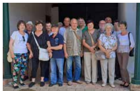
A Kismányoki Nyugdíjas Klub tagjai a bataapáti tájház udvarán

A helyi Naspolya Panzióban elfogyasztott közös ebéd után a kismányoki küldöttség megtekintette a bataapáti evangélikus templomot, valamint a tájházat. A kirándulás végén a nyugdíjasok értékelése szerint nemcsak szép, de nagyon hasznos napot tölthettek Bataapátiban. A látottak alapján egyöntetűen kijelentették: ismételten megbizonyosodtak a tároló tökéletesen biztonságos mivoltáról.