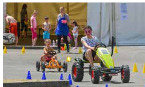
A gokártozás a kisebbek és nagyobbak körében egyaránt sikert aratott