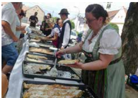
Frissen sült rétesek kínálták magukat

BÁTASZÉK Két év kényszerszünet után június 5-én, vasárnap ismét várta a közönséget a Bátaszéki Pünkösdi Rétesfesztivál. A sorban az immár kilencedik találkozót két helyi szerveződés egymással karöltve rendezte, nevezetesen a Bátaszéki Német Nemzetiségi Egyesület és a Bátaszékért Marketing Nonprofit Kft.